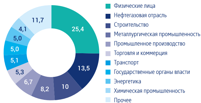
Топ-10 отраслей в кредитном портфеле группы ВТБ на 31.12.2017 2

ВТБ ежегодно наращивает клиентскую базу и объем кредитования клиентов. Размер кредитного портфеля ВТБ в 2017 году составил около 9,7 трлн рублей, увеличившись на 3 % по сравнению с 2016 годом. Основную долю кредитного портфеля по-прежнему составляют физические лица, нефтегазовая и строительная отрасли.